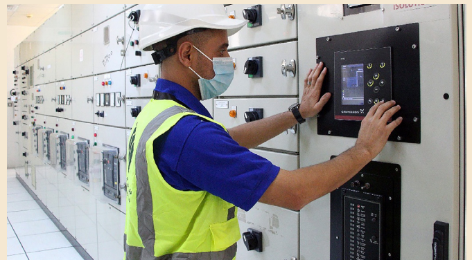
Mit einer Aufrüstung der Pumpenanlage, Dedicated Controls und einem Fernverwaltungssystem von Grundfos konnte die RAKWA 20 % Energie und 12 % der Gesamtbetriebskosten einsparen.