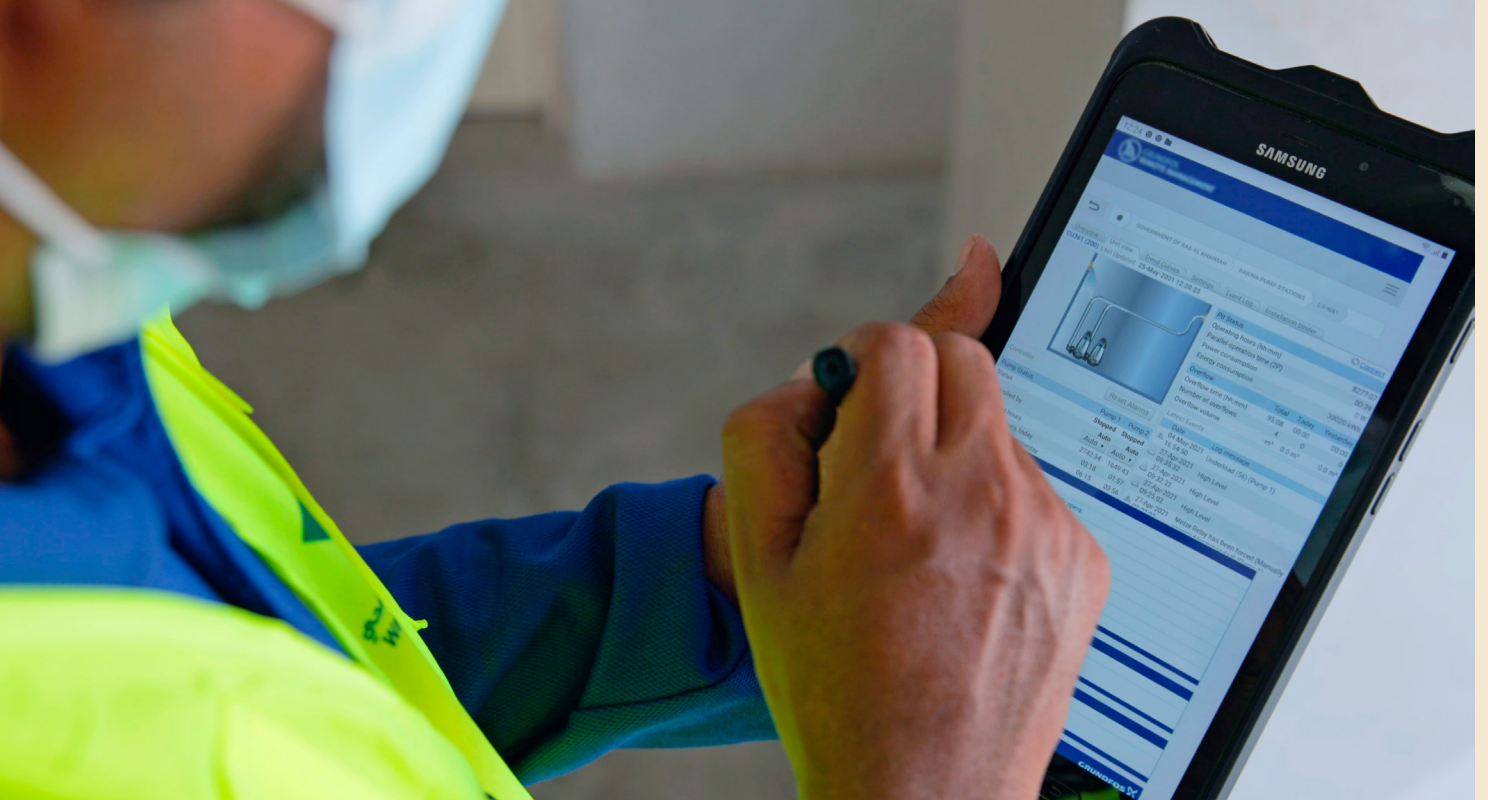
Mit dem Fernverwaltungssystem von Grundfos kann die RAKWA ihre Anlagen per Tablet, Smartphone und Desktop-Computer überwachen. Das reduziert die Anzahl der Besuche vor Ort.